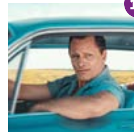
Film Twee keer waargebeurd