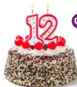
Premies op een rij